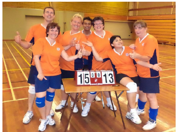
Winnend team: Verburch