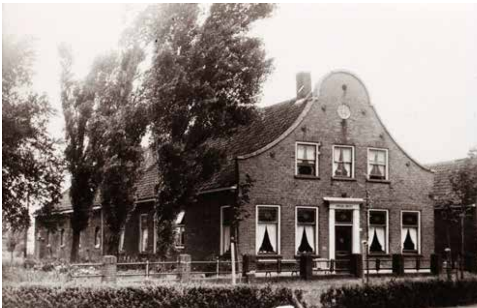
boerderij Vredebest aan de Kerkstraat, hoek Mariëndijk (collectie HVWK).

De wandeling begint om 13.30 uur bij de Kastanjehof, Kerkstraat 43a. Deelname is 2 euro per persoon, waarbij inbegrepen koffie of thee na afloop. Aanmelden kan bij Jeannette van Zeijl op telefoonnummer (06) 46 69 64 71. Wees er snel bij, want vol is vol. Goede wandelschoenen worden aangeraden.